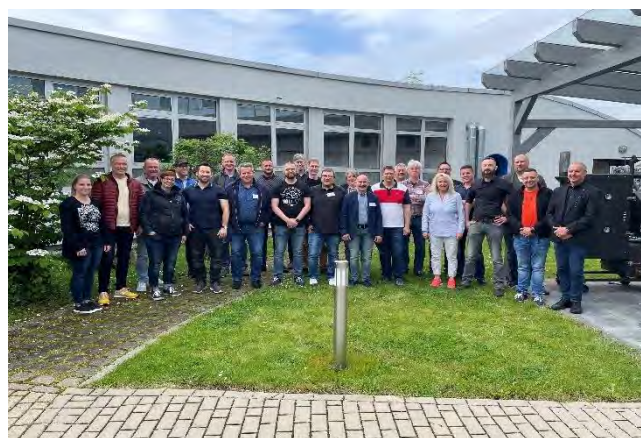
Bild: BEW-Erfahrungsaustausch 2023